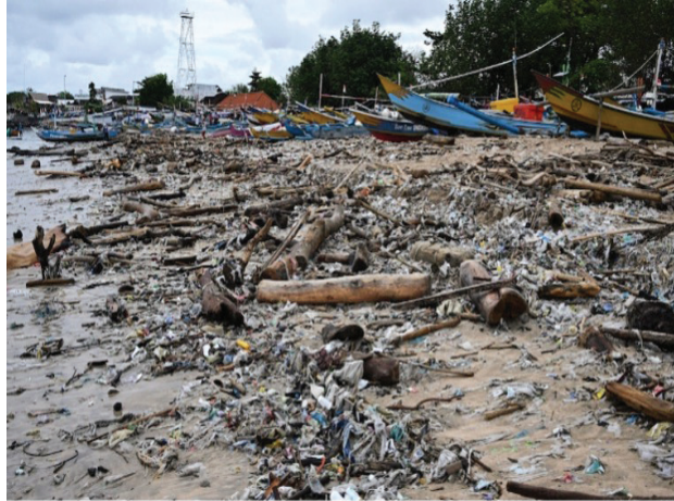
Face cachée de Bali, la pollution