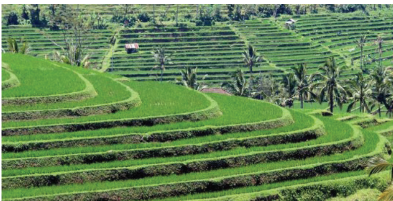
Le subak balinais

Depuis des siècles, les habitants de Bali cultivent le riz grâce à un système d'irrigation traditionnel appelé "Subak".