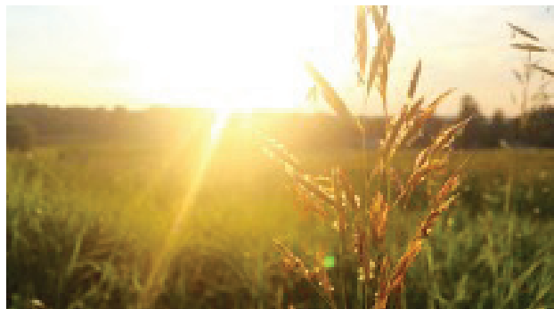
Figure 2 : Lumière naturelle - Nature et confort

Depuis des milliers d'années, les êtres humains vivent au rythme du lever et du coucher du soleil.