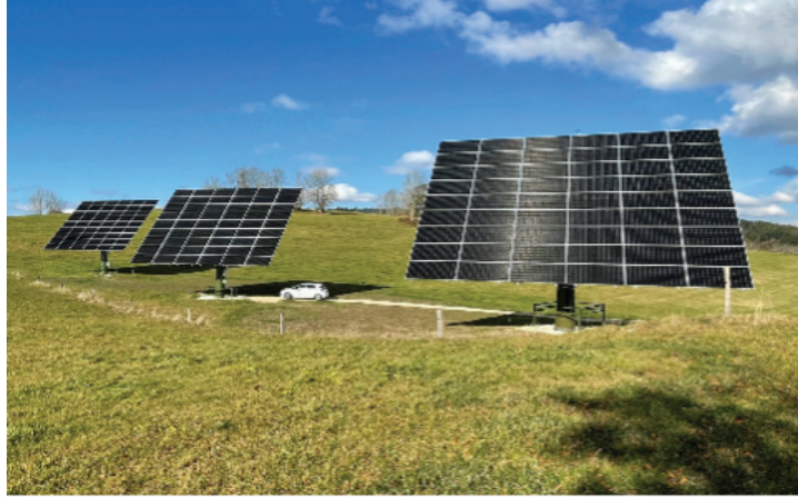
Figure 2 : Traqueurs solaires