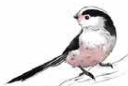
Orite à longue queue Aegithalus caudatus