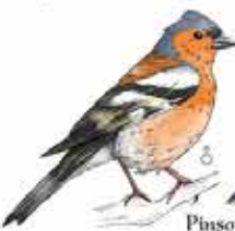
Pinson des arbres Fringilla coelebs