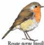
Rouge-gorge familier Erithacus rubecula