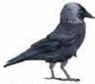
Choucas des tours Coloeus monedula