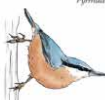
Sittelle torchepot Sitta europaea