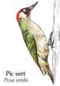
Pic vert Picus viridis