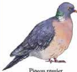
Pigeon ramier Columba palumbus