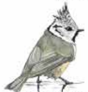
Mésange huppée Lophophanes cristatus