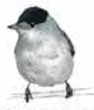
Fauvette tête noire Sylvia atricapilla