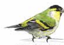
Tarin des aulnes Spinus spinus