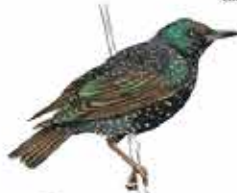
Etourneau sansonnet Sturnus vulgaris