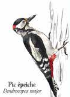
Pic épeiche Dendrocopos major