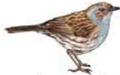
Accenteur Mouchet Prunella modularis