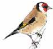
Chardonneret élégant Carduelis carduelis