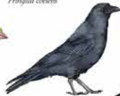
Corneille noire Corvus corone