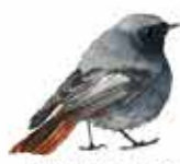
Rouge queue noir Phoenicurus ochruros