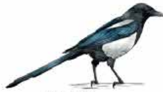
Pie bavarde Pica pica