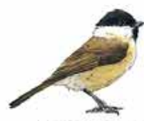
Mésange nonnette Poecile palustris