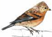
Pinson du nord Fringilla montifringilla