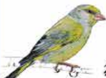
Verdier d'Europe Chloris chloris