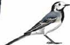
Bergeronnette grise Motacilla alba