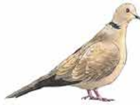
Tourterelle turque Streptopelia decaocto