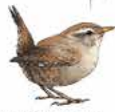
Troglodyte mignon Troglodytes troglodytes