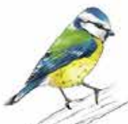
Mésange bleue Cyanistes caeruleus