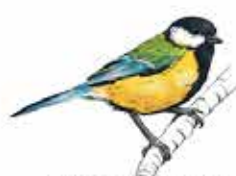
Mésange charbonnière Parus major