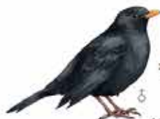
Merle noir Turdus merula