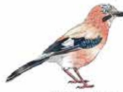
Geni des chênes Garrulus glandarius