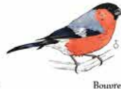
Bouvreuil pivoine Pyrrhula pyrrhula