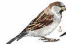
Moineau domestique Passer domesticus