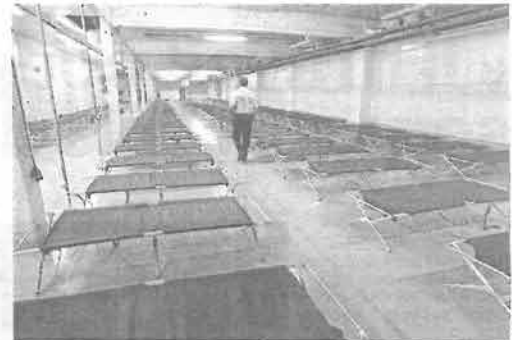
Rungis (Val-de-Marne), le 15 août 2003. Des centaines de lits Picot avaient été apportés par l'armée pour meubler ce hangar en marge du MIN.