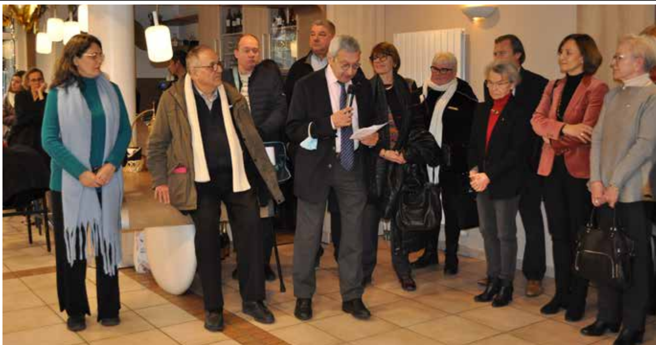
Cérémonie des Voeux du Conseil d'Administration aux Bords de Marne