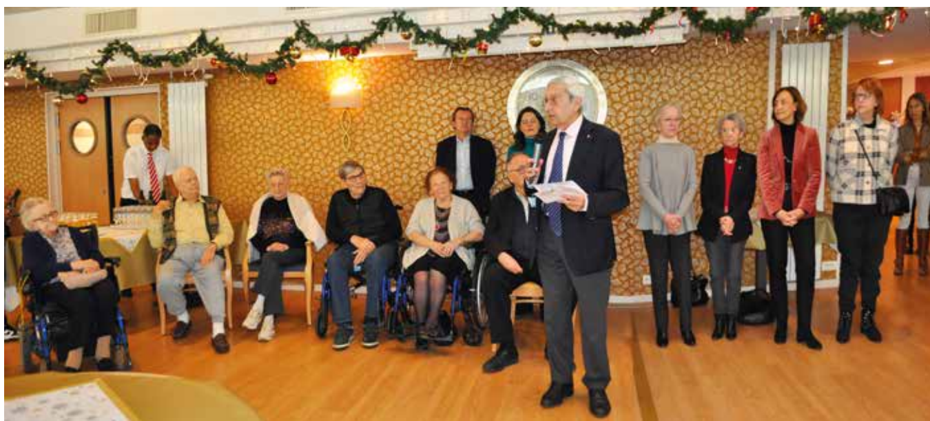
Cérémonie des Voeux du Conseil d'Administration à l'Abbaye