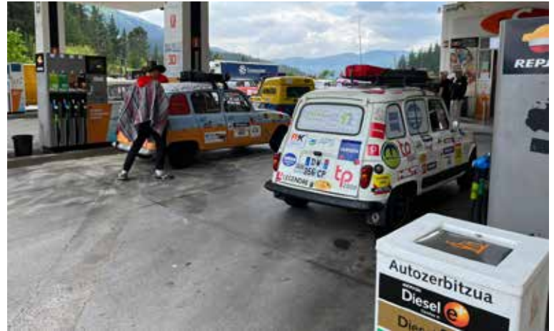
JOUR 2 : Route de Madrid à Algeciras