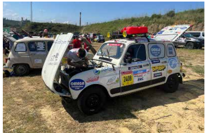
JOUR 7 : Désert Marocain et Merzouga