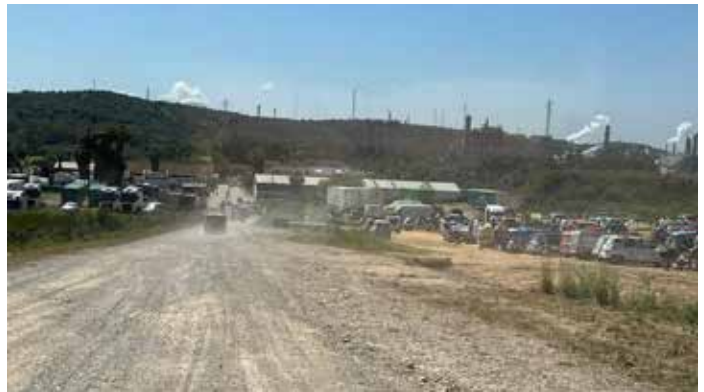
JOUR 3 : Briefing et dernières vérifications avant de prendre le ferry