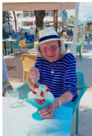
Des moments de détente et de gourmandises