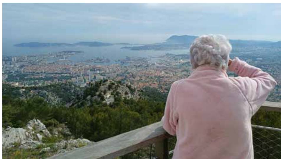
Des visites et balades à la découverte des environs...