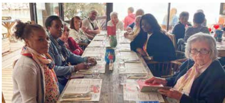
Des restaurants et bons moments.