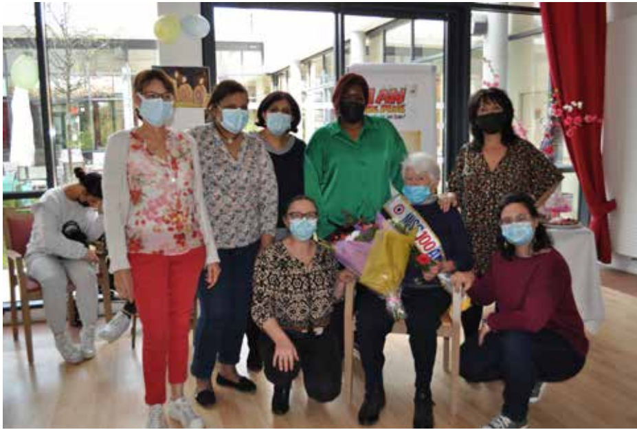
L'ensemble des équipes des Accueils de Jour