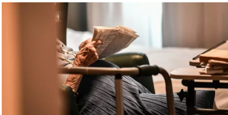
Les restrictions ont été assouplies dans les Ehpad.