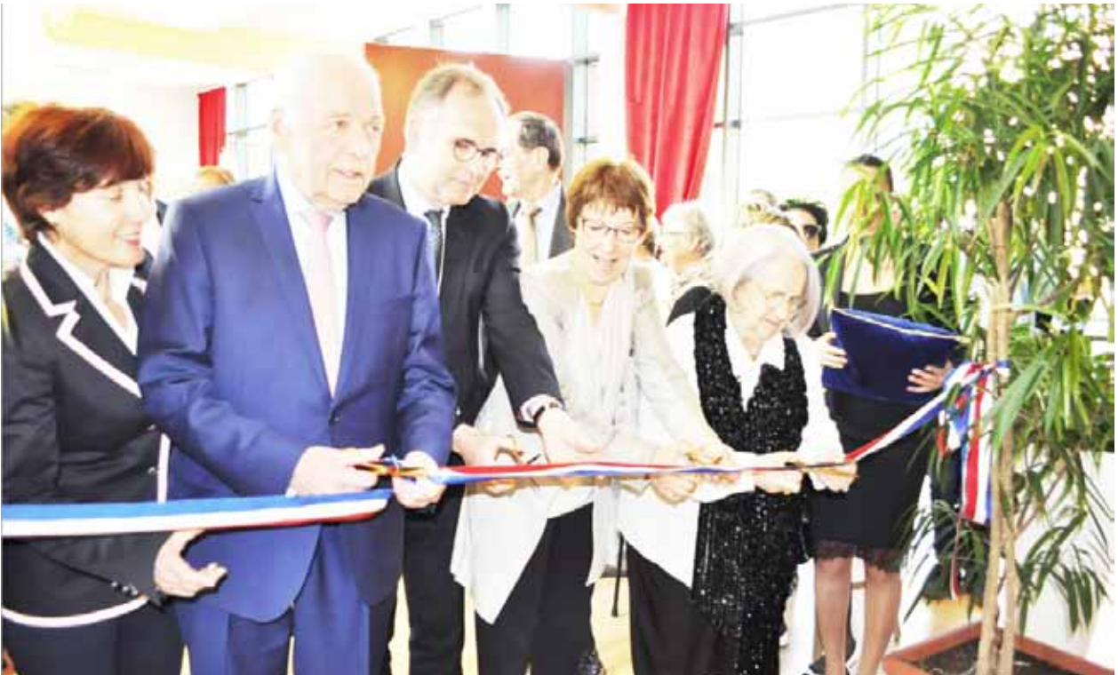
Découpe du ruban