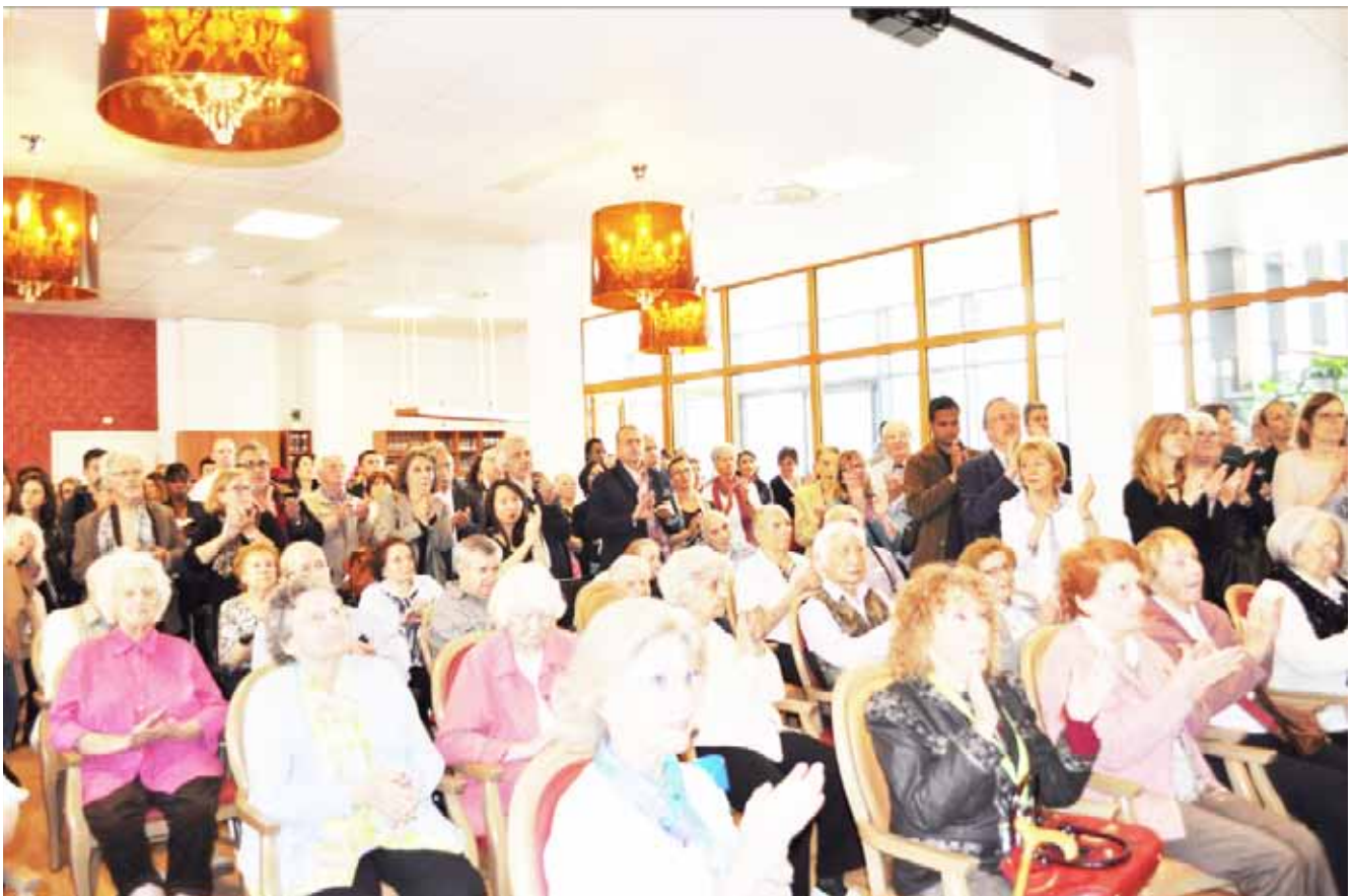
Beaucoup de monde présent à cette inauguration