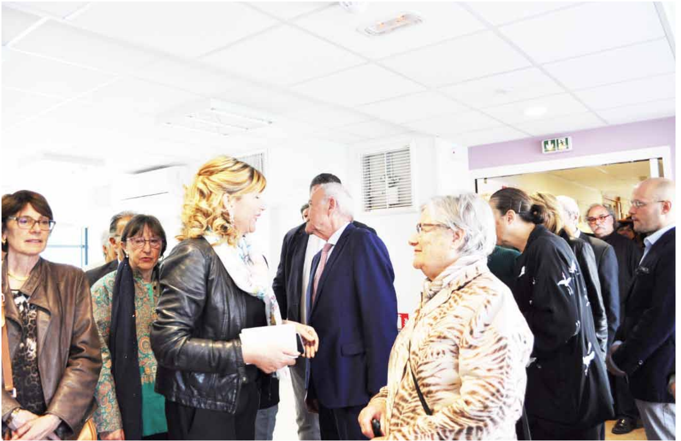
Visite du 1er Étage