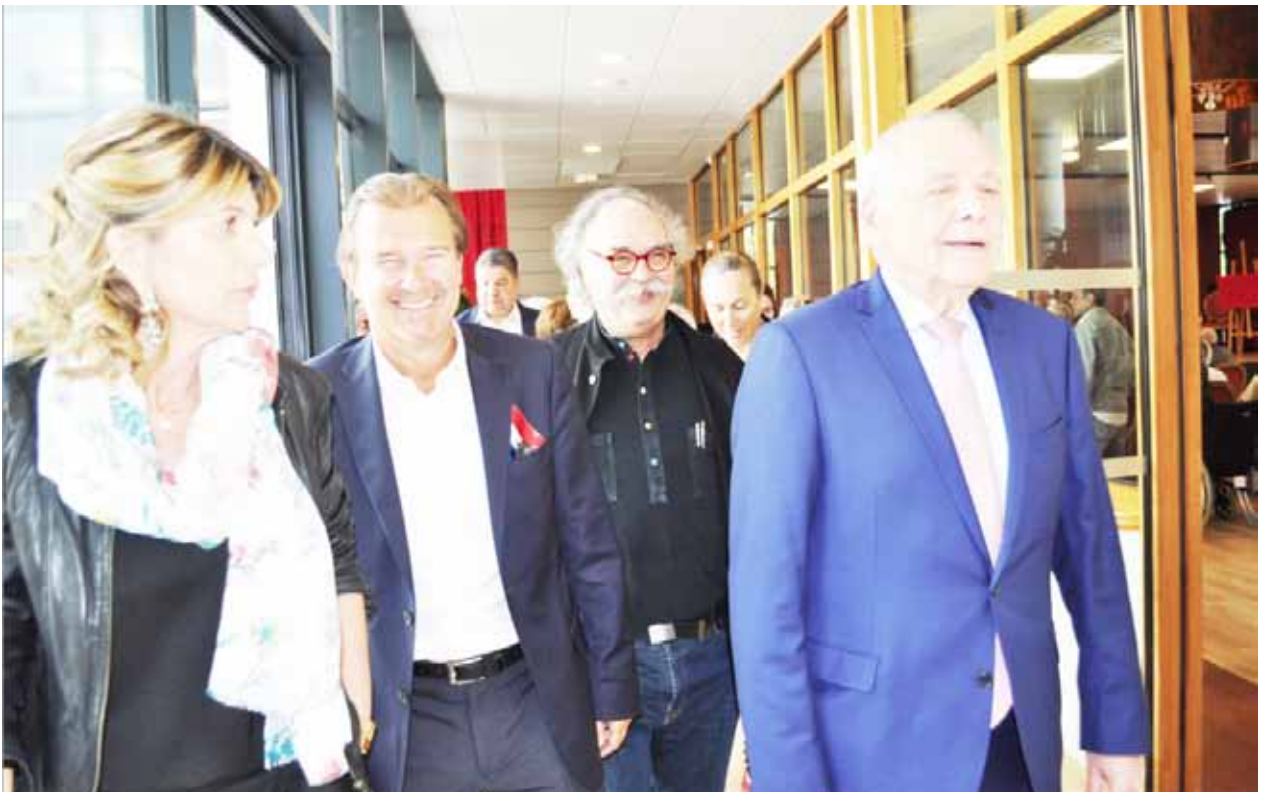
Visite de la Résidence