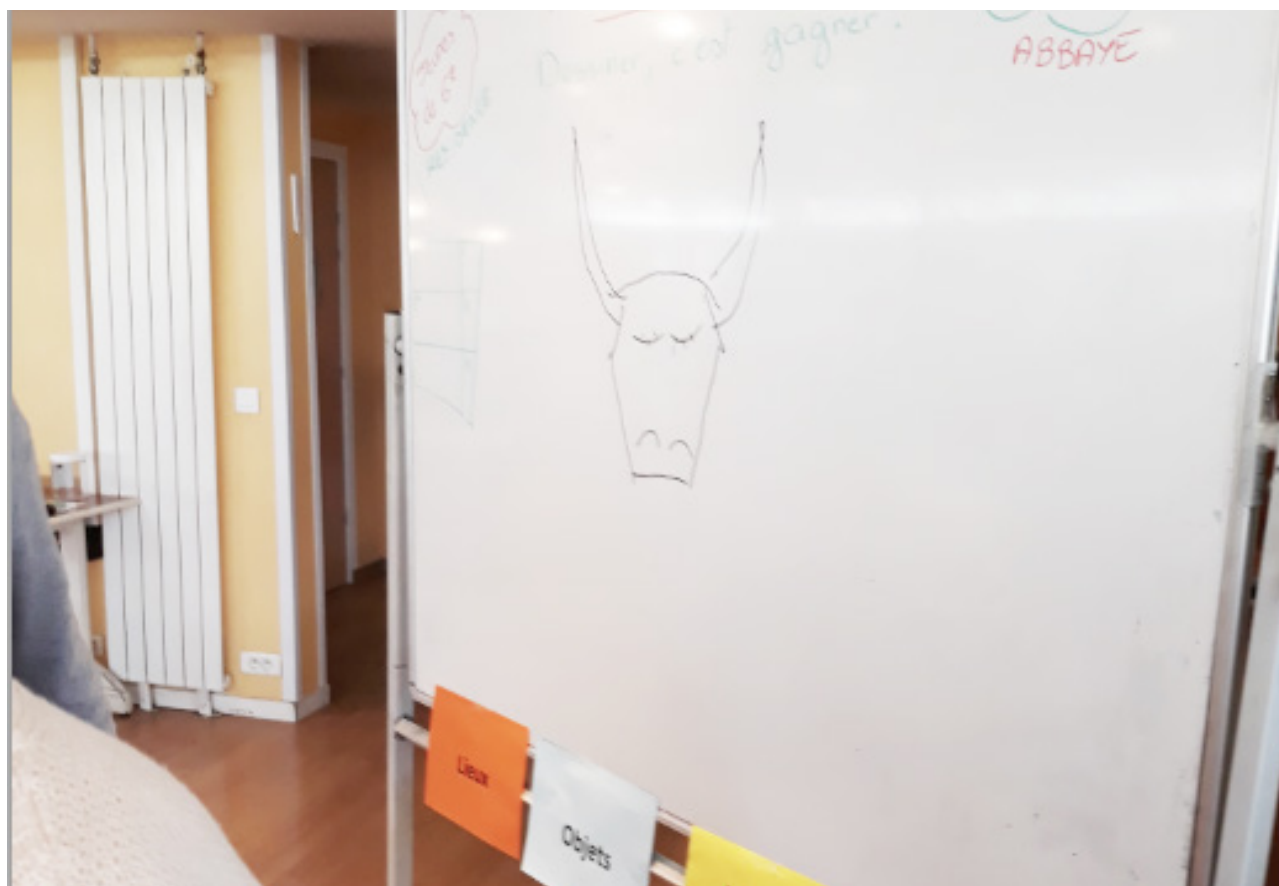
Dessin réalisé par M.Coutand