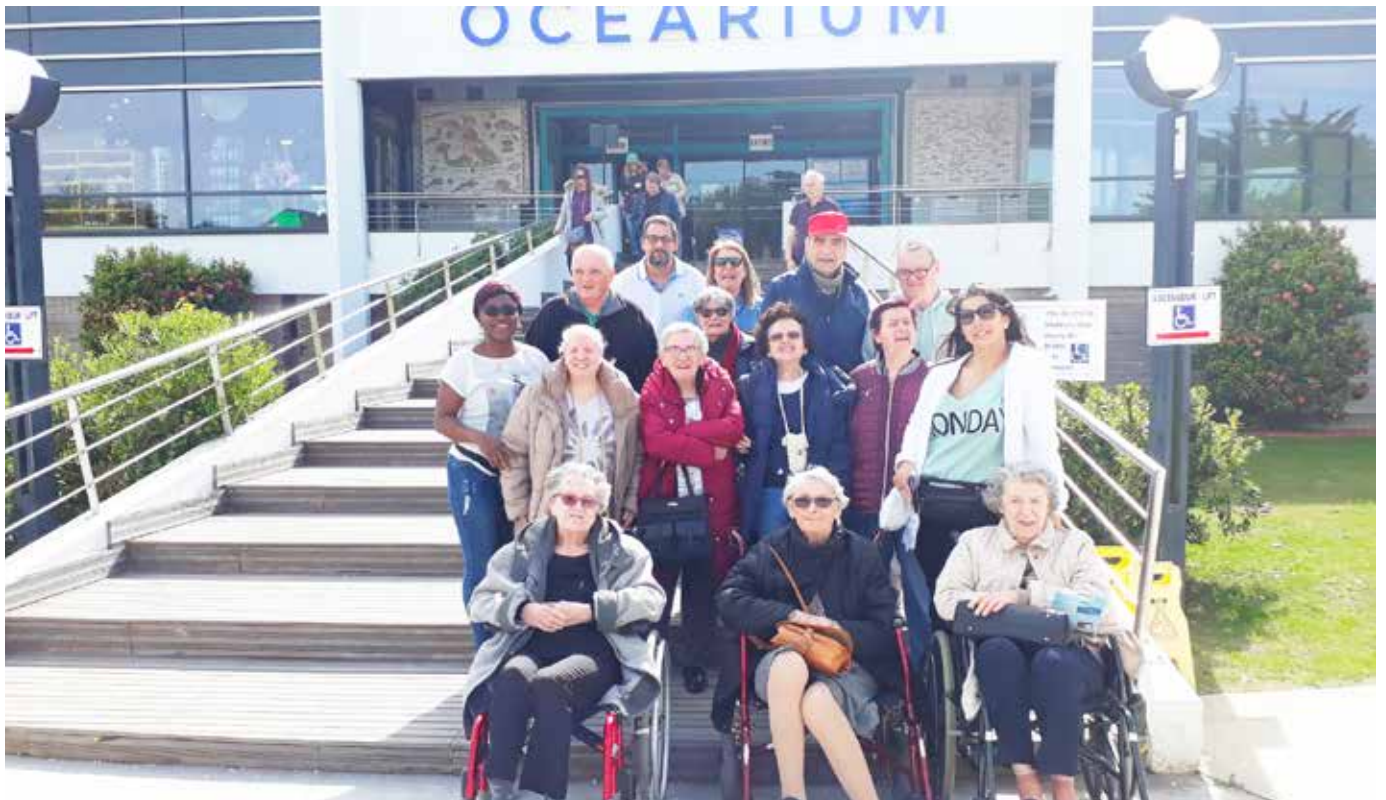
Visite de l'Océarium du Croisic