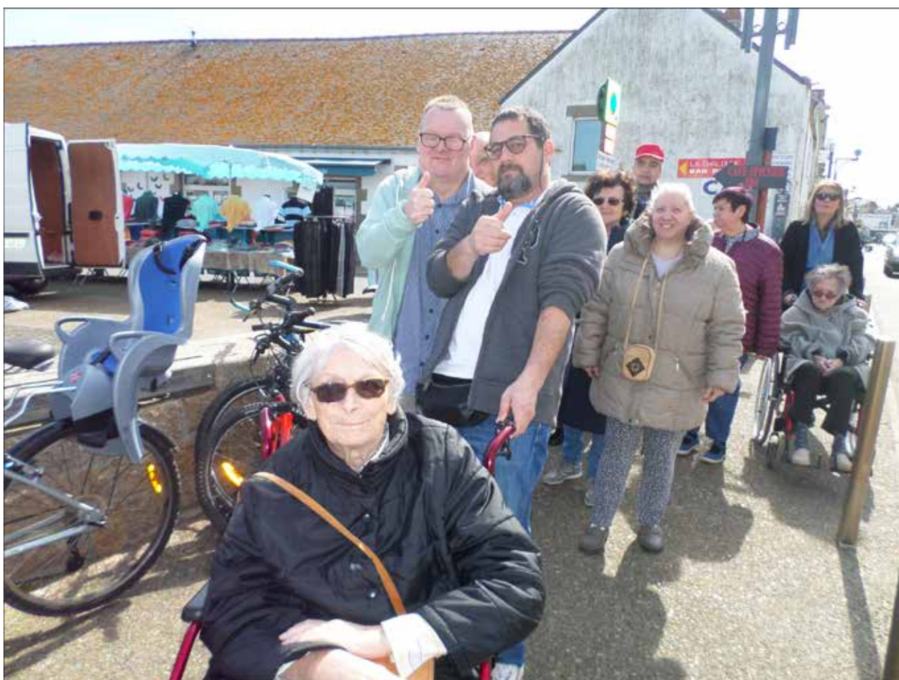
Balade au marché de la Turballe