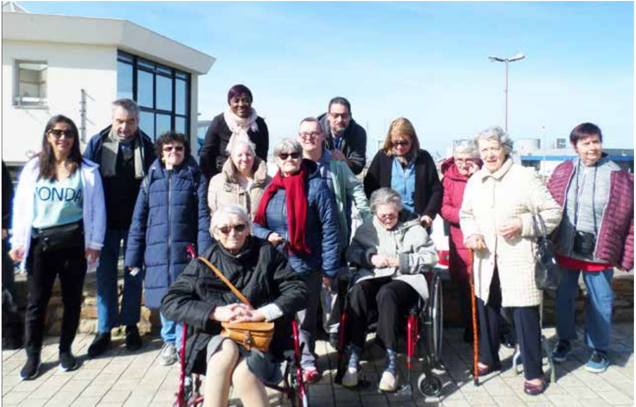
Port de la Turballe