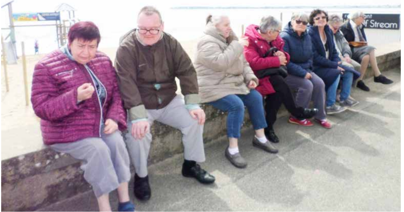
Balade sur le bord de la plage de la Baule