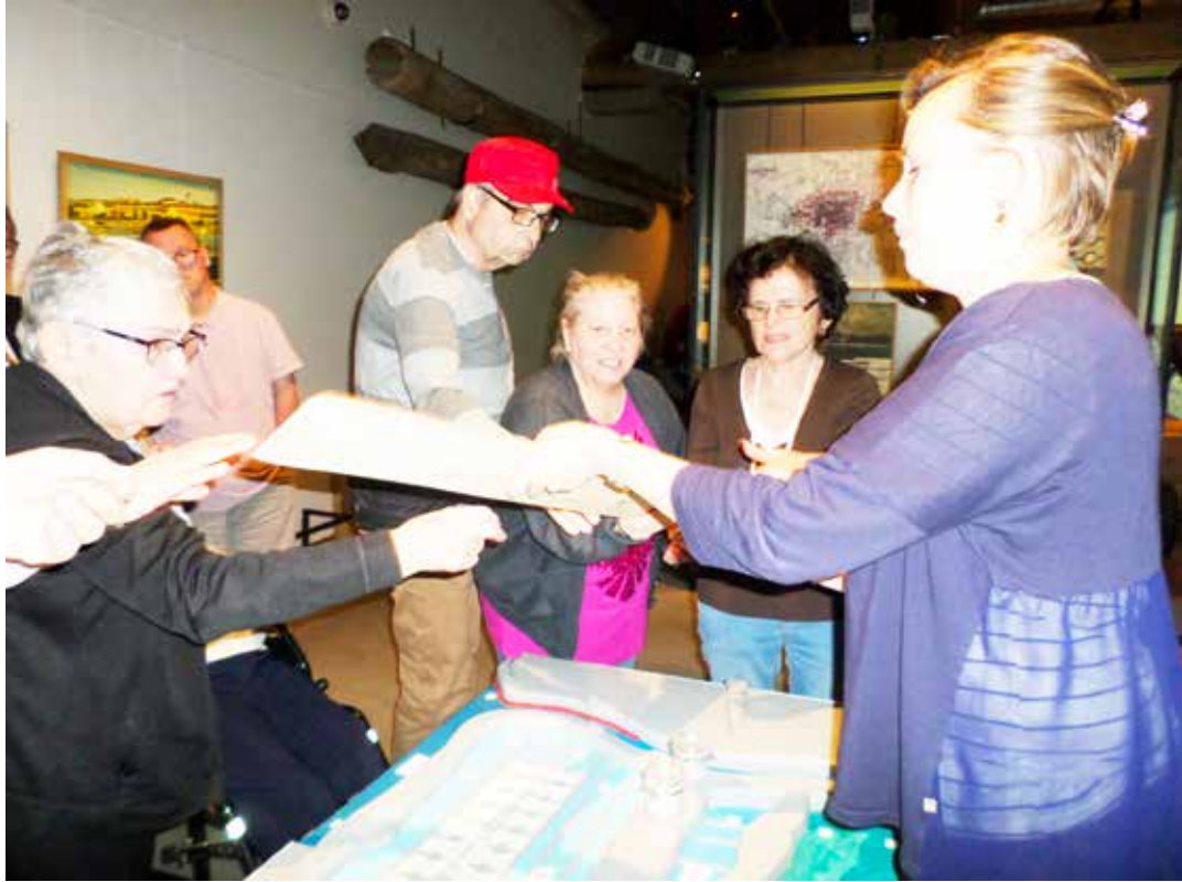
Atelier sur le métier du Paludier