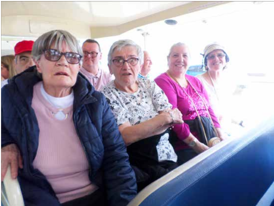
Balade en petit train