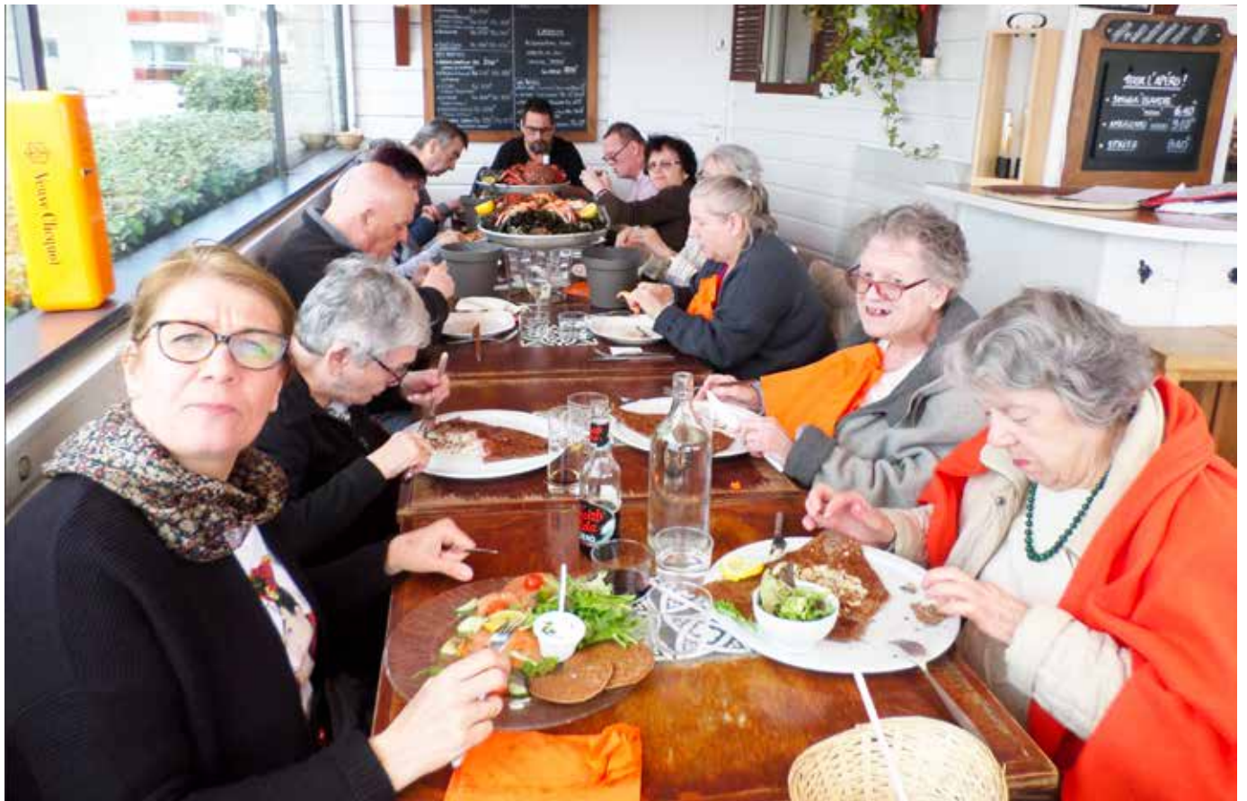
Dégustation de fruits de mer