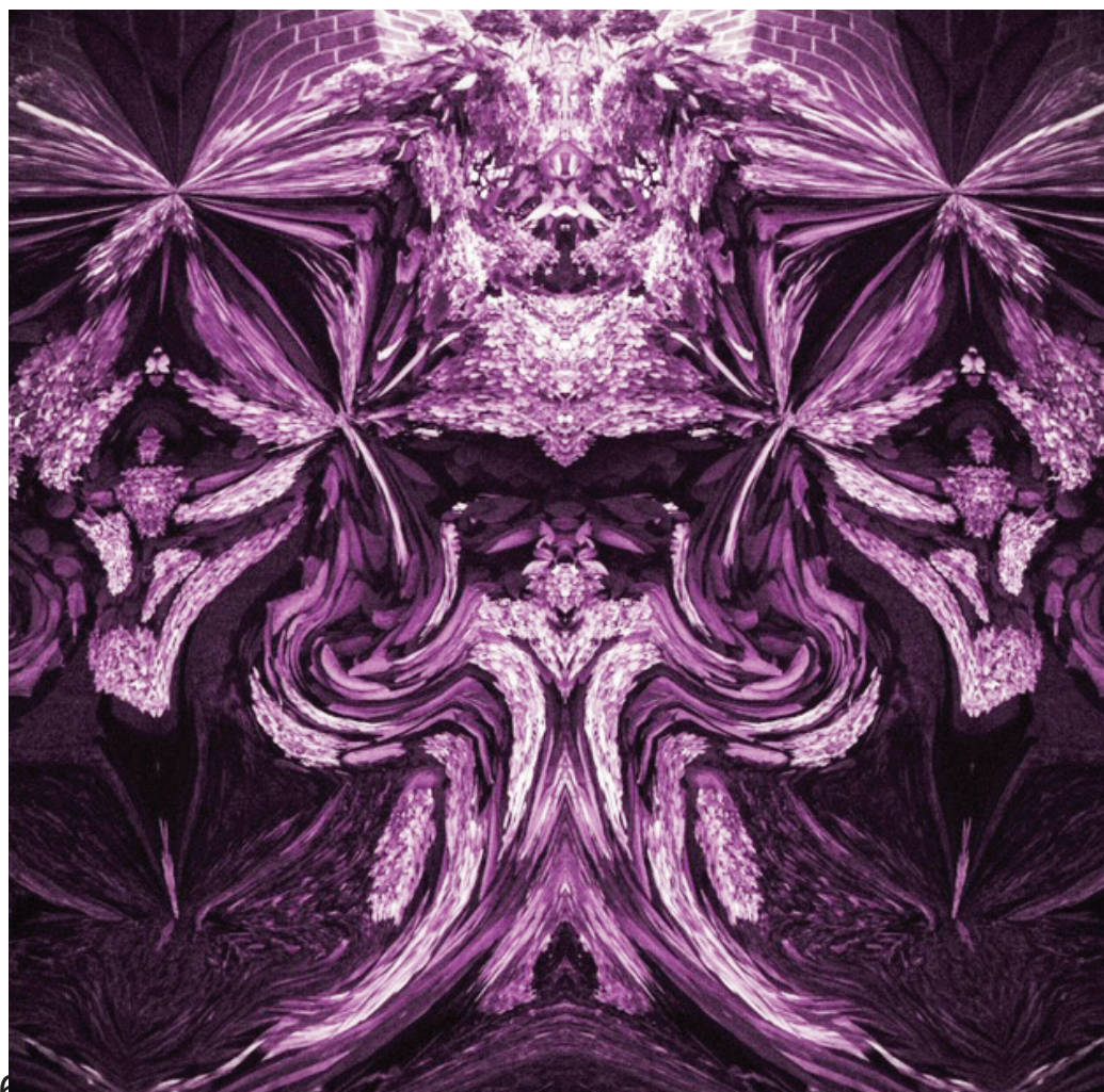
La belle et la bête